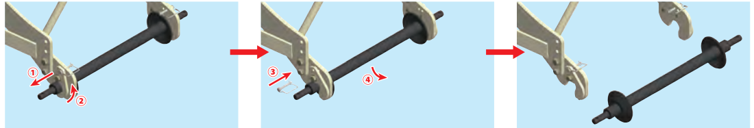
クイックカブラを外す

左右のカブラを固定しているピンを抜き、カブラの角度を変更してピンを挿すと簡単にクイックカブラが外れます。