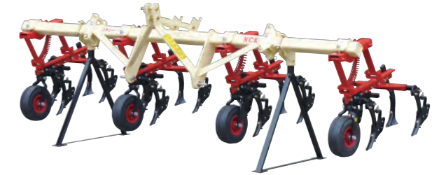
Photo : NCK-43

NCKのフレームをベースに、ご希望の作付条件に対応したカルチベーターを製造いたします。