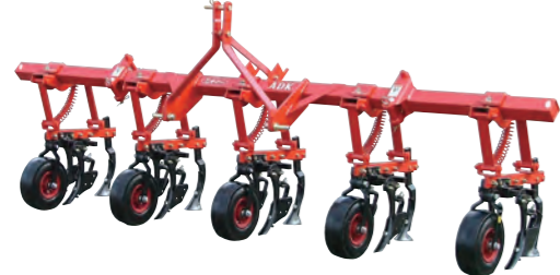
Photo : ADK-5

信頼性、耐久性、使いやすさを追求して誕生した最軽量のトラクター用カルチベーターで、20馬力のトラクターから作業ができます。(3畦タイプもございます。)