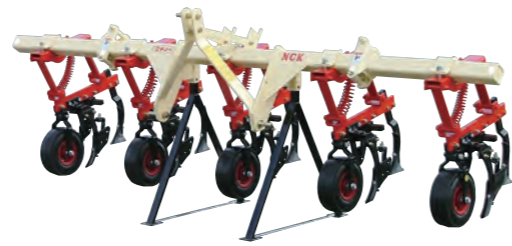
Photo : NCK-5

ADKの2.5倍のフレーム強度で、サブソイラーなみに畦間を深く中耕できる深耕カルチベーターとして登場。以来、全国各地でご使用いただいております。(3畦タイプもございます。)