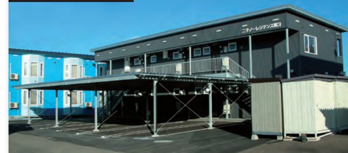
2戸 (LK12畳)、4戸 (LK9畳、洋間5畳、4.5畳)