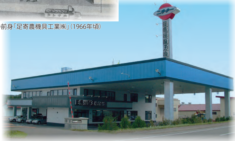
「日農機製工(株)」(現在)